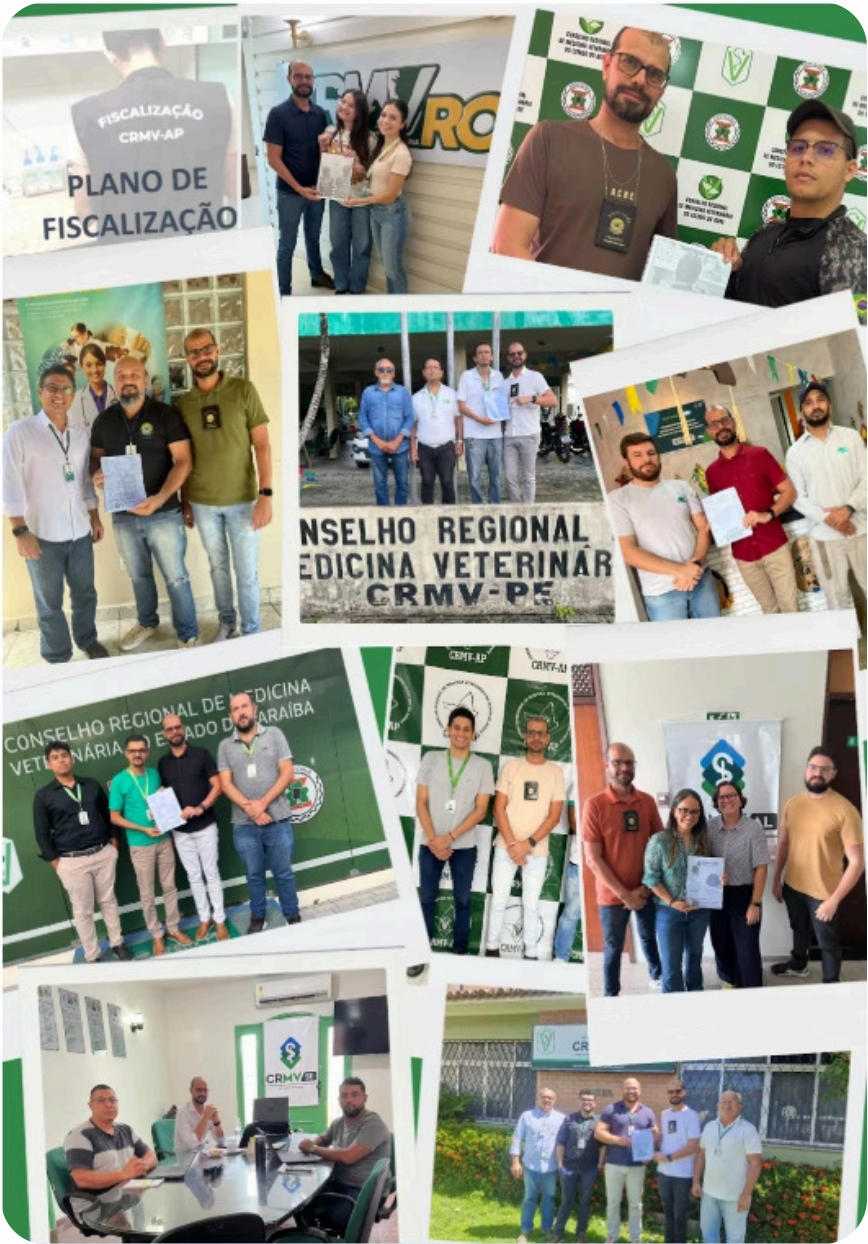
Treinamentos in-loco para elaboração do Plano Estadual de Fiscalização nos Regionais